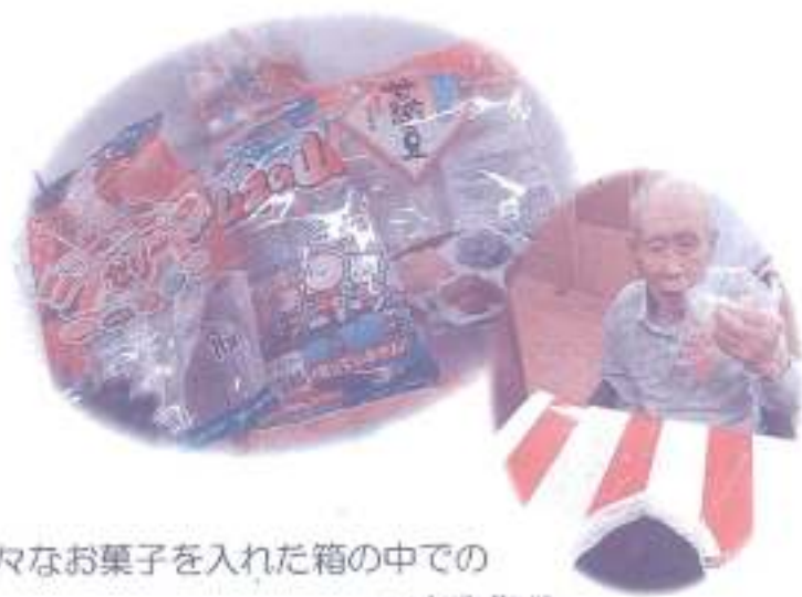
様々なお菓子を入れた箱の中での つかみ取り