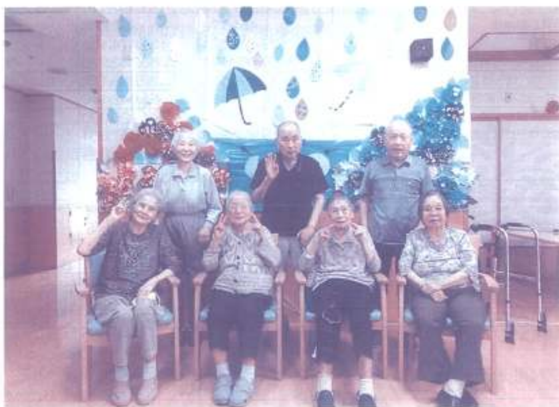
【雨にも負けずコロナ禍にも負けず】

発行日 令和2年7月1日 第78号 発行 社会福祉法人 瑞穂会 ふれあい新聞編集部 本部 〒444-0936 岡崎市上佐々木町字大宮49番地 TEL (0564) 34-3666 FAX (0564) 34-2347