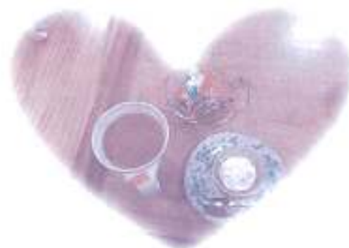
本日の手作りおやつです♀