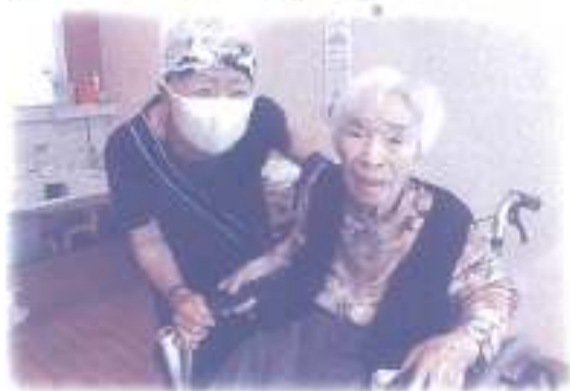
3ヶ月振りの感動の再開！会えない時は、一生懸命手紙を書いていました。

第一に考えながら、これからもしっかりとした感染症対策を行なっていきたいと考えています。